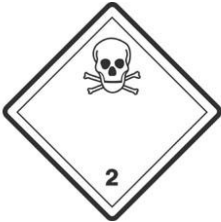
Giftige Gase 2.3