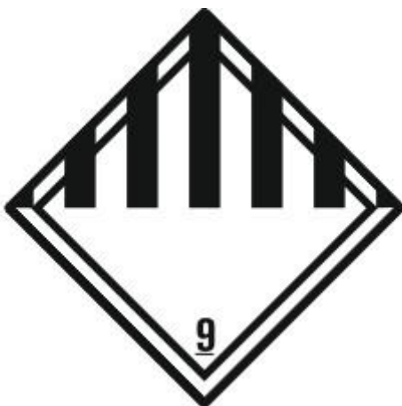
Verschiedene gefährliche Stoffe und Gegenstände 9