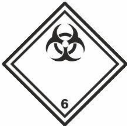
Ansteckungsgefährliche Stoffe 6.2