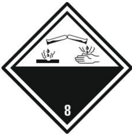
Ätzende Stoffe 8