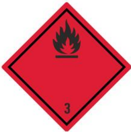
Entzündbare flüssige Stoffe 3