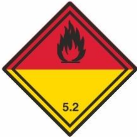
Organische Peroxide 5.2