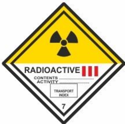
Radioaktive Stoffe 3