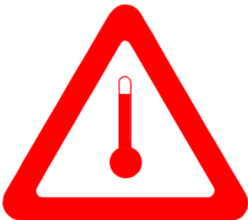
Kennzeichnung für in erwärmtem Zustand transportierte Materialien