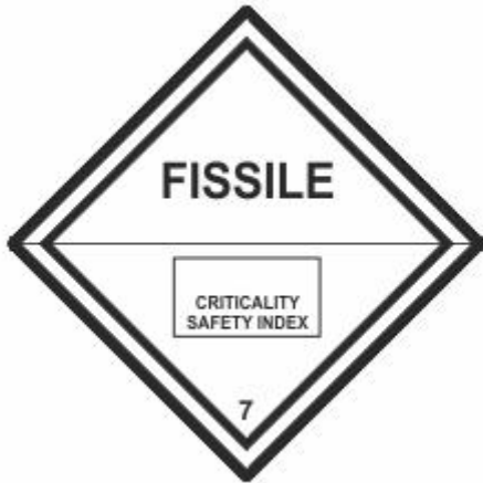
Radioaktive Stoffe - Fissile