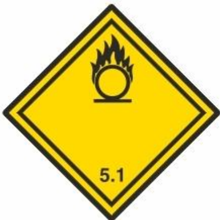
Entzündend (oxidierend) wirkende Stoffe 5.1