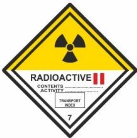
Radioaktive Stoffe 2