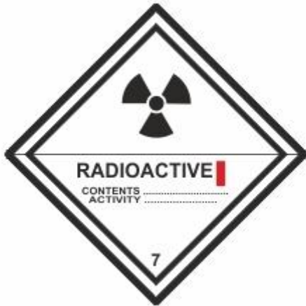
Radioaktive Stoffe 1