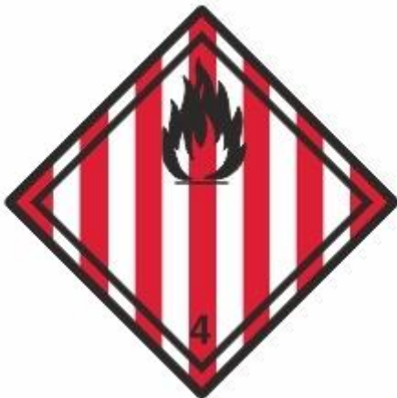
Entzündbare feste Stoffe 4.1