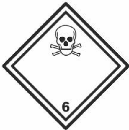
Giftige Stoffe 6.1