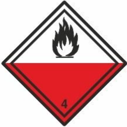
Selbstentzündliche Stoffe 4.2