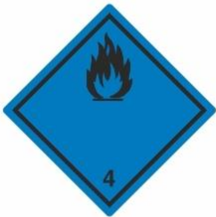
Stoffe, die mit Wasser entzündliche Gase bilden 4.3